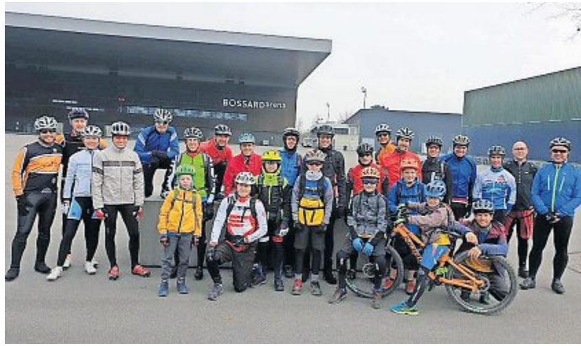
Der Veloclub Baar-Zug feiert heuer sein 111. Jubiläum. Herzlichen Glückwunsch!

Der VC Baar-Zug betreut die aktuelle Mountain-Etappe der Raiffei-