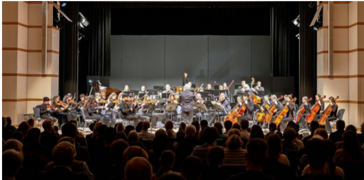
Öffentliche Aufführung im Lorzensaal Cham.