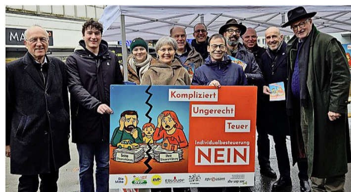
Diverse SVP- und Mitte-Politiker bei der Standaktion der Zuger Allianz «Nein zum Steuerschwindel» auf dem Zuger Bundesplatz.

Viele Passanten äusserten im Gespräch ihre Absicht, in den nächsten Tagen ein klares Nein zu dieser Steuervorlage in die Urne zu legen. Genau dies war das Ziel dieser gemeinsamen Aktion. Ein besonderes Highlight waren zudem die selbst hergestellten Give-aways: Mit kreati-