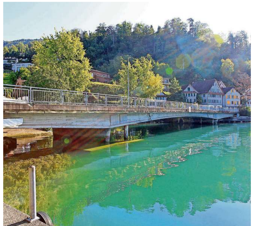
Die Seefeldbrücke wird durch einen Neubau ersetzt. Die Bauarbeiten dauern bis Herbst 2025.

Der Zugang und die Zufahrten zu den Liegenschaften sind, abgesehen von kurzzeitigen Einschränkungen wie der Belagseinbau, jederzeit gewährleistet. RC