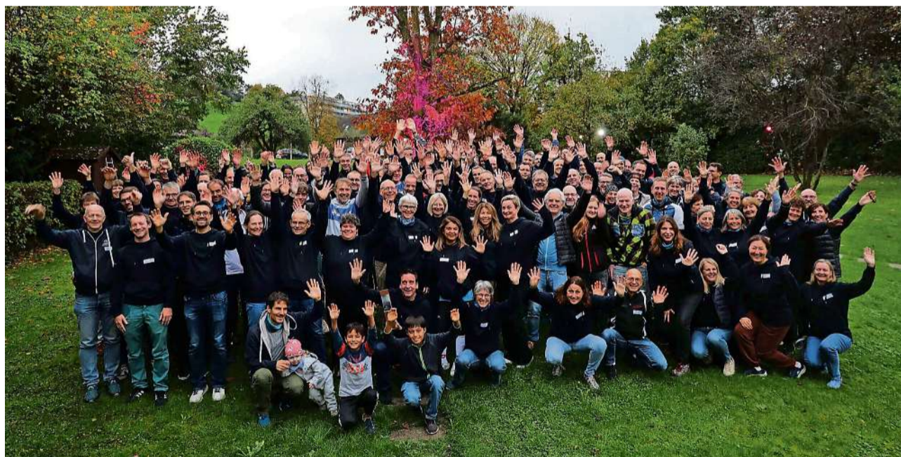
Rund 140 Teilnehmerinnen und Teilnehmer freuten sich über die Apéro-Einladung der «Zugerberg Finanz».