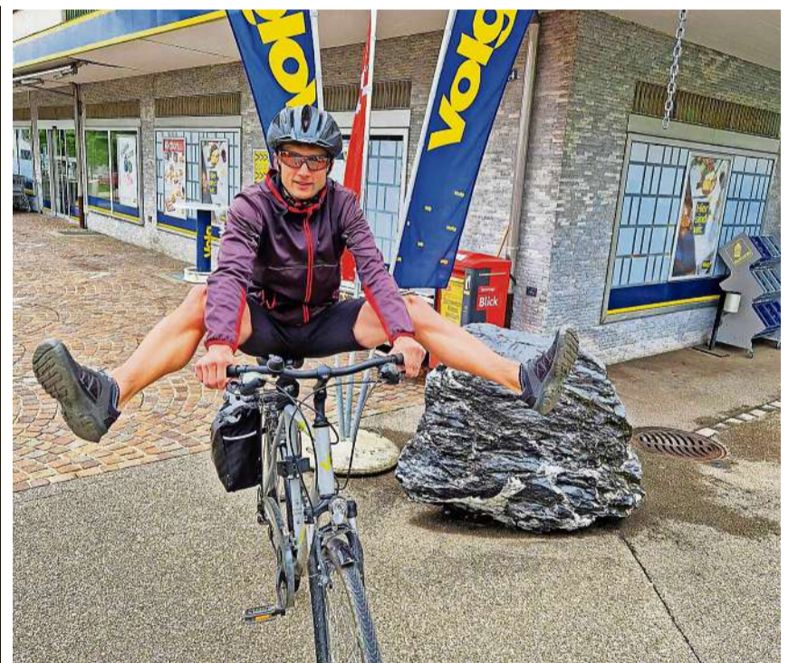
Ab aufs Velo, heisst es jetzt wieder bei Volg. Jede Woche werden E-Bikes und sportliche Volg-Velotrikots verlost.

Für die Zugerberg Finanz Trophy Sara Hübscher