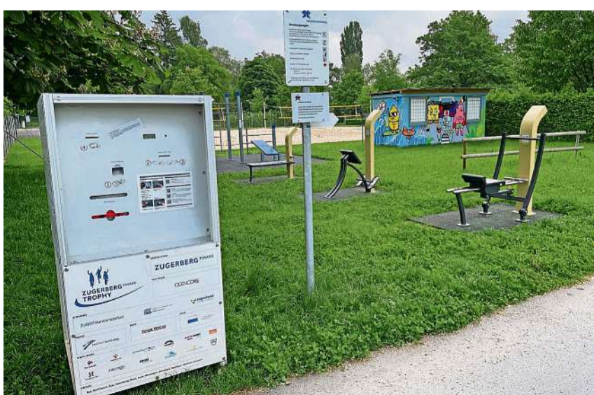
Aktuell steht das Zeitmessgerät bei der Hünenberger Badi für die Etappe Ennetsee und an der Weinbergstrasse in Zug, von wo es auf den Zugerberg geht.