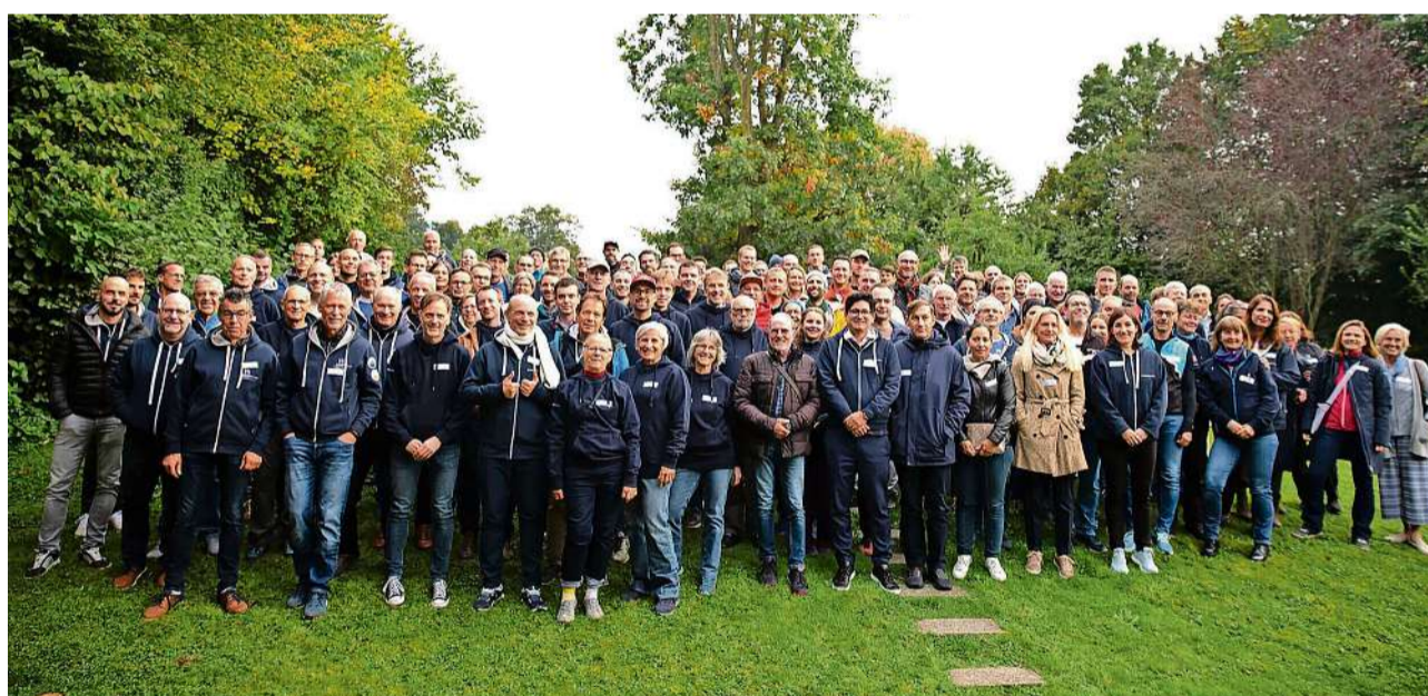
Die Community der Zugerberg Finanz Trophy beim Saisonabschluss-Apéro vom Freitag, 3. Oktober 2025.

Der Abschluss-Apéro bietet jedes Jahr Gelegenheit, die Gesichter hinter den Namen in der Rangliste kennenzulernen – und natürlich werden