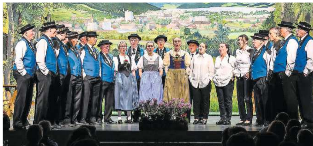
Der Jodlerklub Echo Baarburg am Frühlingskonzert 2025.

Unter dem Motto «99 Jahre – und kein bisschen müde», führte der Jodlerklub Echo Baarburg am Samstag, 26. April, das diesjährige Frühlingskonzert durch. Im gut besuchten Gemeindefestsaal präsentierten sowohl der gastgebende Klub als auch die eingeladenen Gastformationen ihr Können.