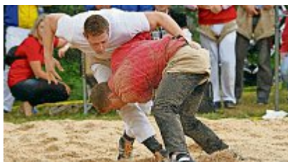
Das 10. Fraumatt-Schwinget findet am 18. August in Oberwil statt.

Die Gründungsidee für ein Schwinget in Oberwil im Leimental fusste 2009 auf dem Bestreben, den vielen Jugendlichen, die im Schwingklub Oberwil und in Klubs der Umgebung als Jungschwinger den Sport kennenlernen, in der Nähe ein Schwingfest anzubieten, wo sie das Erlernte in der Praxis umsetzen und sich mit echten Gegnern messen konnten. 2009 wurde das Fraumatt-