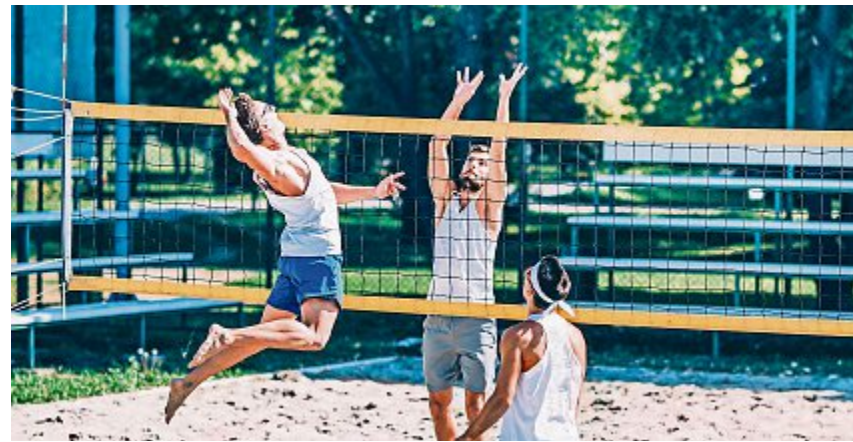
Am 18. und 19. August findet in der Badi Cham ein Beachvolleyball-Turnier statt.