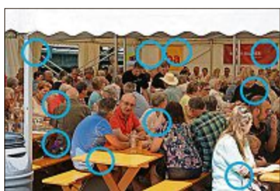
Auflösung der letzten Ausgabe